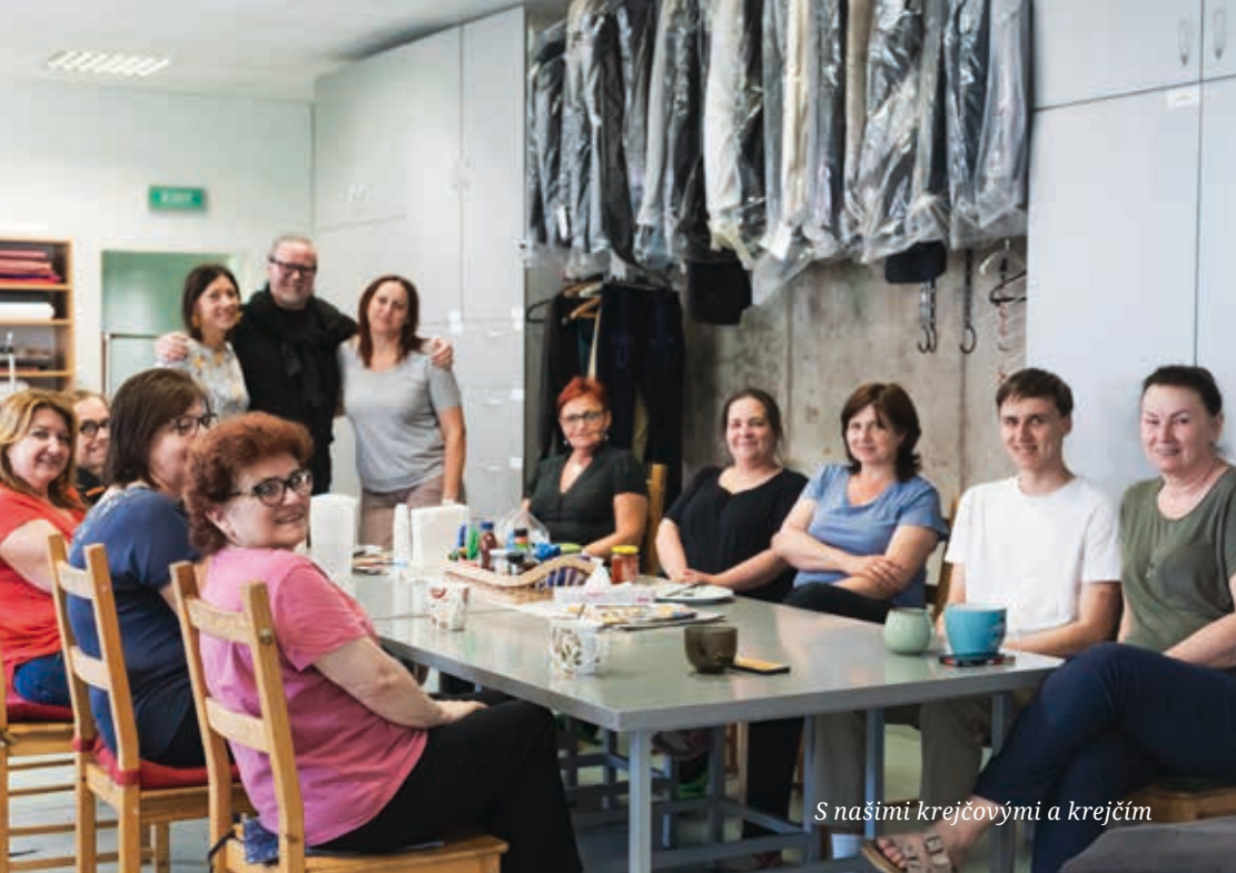
S našimi krejčovými a krejčím

nál přinesu do krejčovny pro zajímavost, třeba nějaký kabátek 150 let starý, tam na to koukají a říkají: „No vidíš, takhle se to dělalo...“ Ano, historická móda mě baví a jsem vždycky radostný, když něco takového můžu dělat.